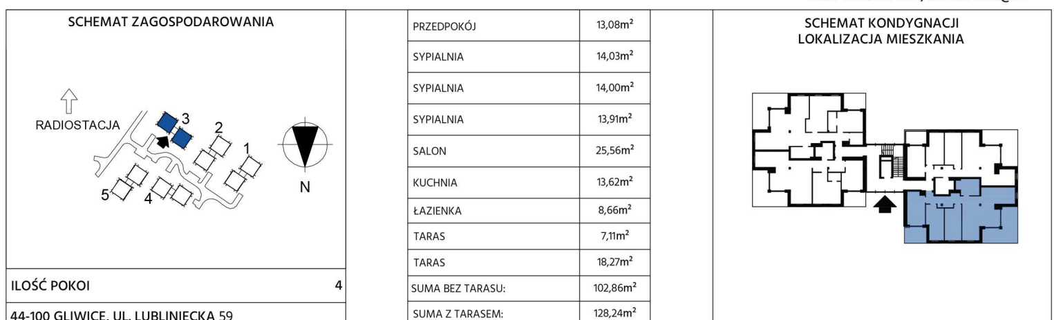
RZUT MIESZKANIA, SKALA 1:100@a4

wymiary na rysunku nie uwzględniają grubości tynku