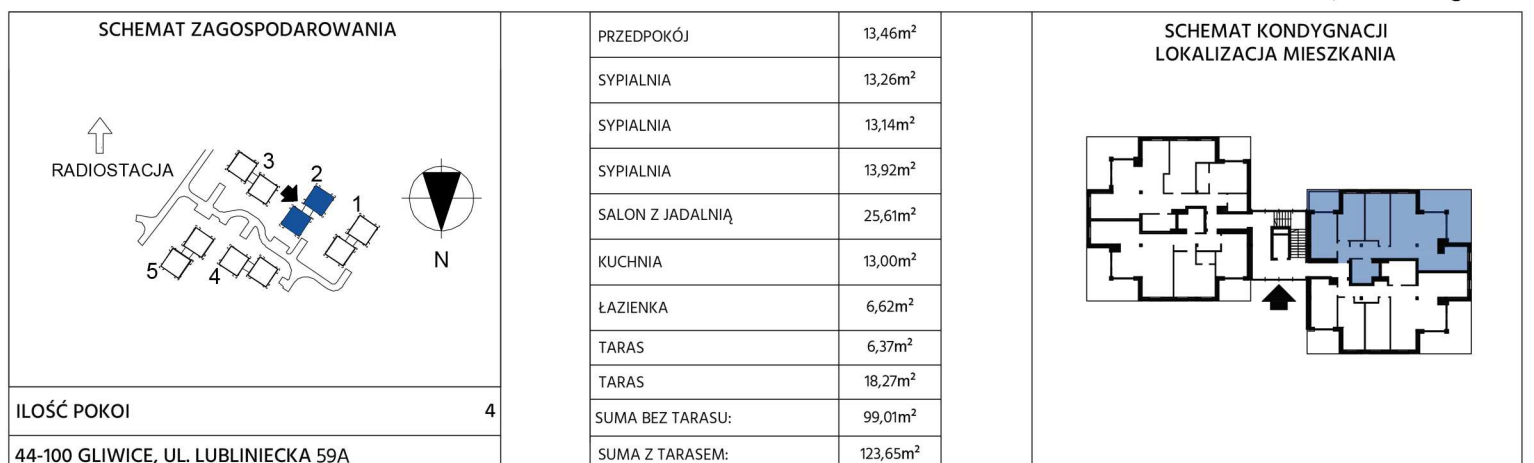
RZUT MIESZKANIA, SKALA 1:100@a4

wymiary na rysunku nie uwzględniają grubości tynku