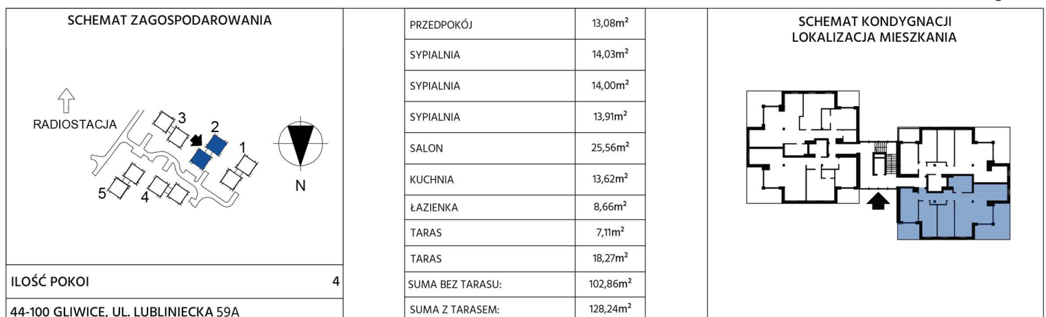
RZUT MIESZKANIA, SKALA 1:100@a4

wymiary na rysunku nie uwzględniają grubości tynku